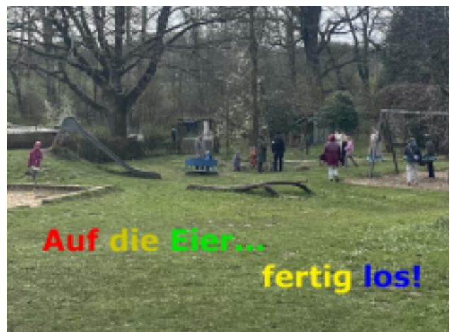
Und endlich ging das Eiersuchen auf dem Eichhof los!