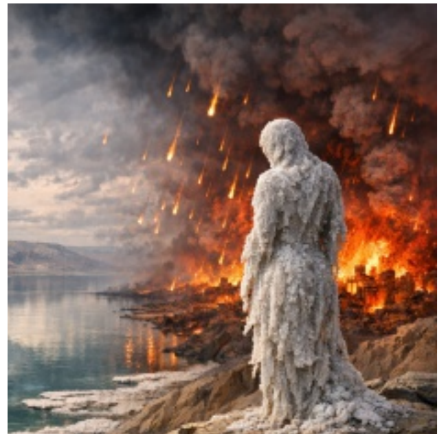
Lots Frau zur Salzsäule erstarrt (KI-generiert)

Himmel loderten, drehte sich Lots Frau um und erstarrte zur Salzsäule. Ob es Entsetzen war oder Neugier – was die Frau antrieb, berichtet die Bibel nicht. Die Städte waren durch