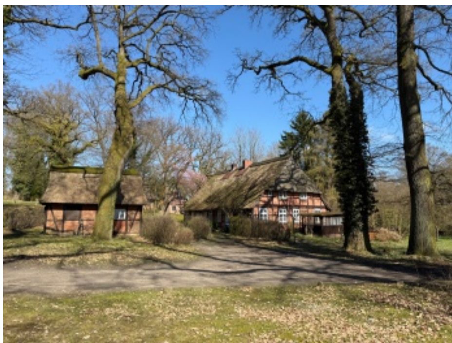
1831 erbaut, Schulhaus, Gemeindehaus, Wohnung der Gemeindegewerter, Zuhause der Küster-Familien, Buchhandlung, Pfadfinderbüro, Wohnhaus: Das Küsterhaus der Gemeinde Sinstorf hat unterschiedlichste Nutzungen erfahren.

Der Eichhof in Sinstorf ist etwas ganz Besonderes, weit mehr als nur ein Stück Land. Welche Kirchengemeinde verfügt schon über solch ein Gelände, mehr Park als Garten? Garniert mit zahlreichen riesengroßen Namenspaten, Jahrhunderte alt, die im Sommer Schatten spenden, unter denen man spielen, träumen, zelten, feiern kann?