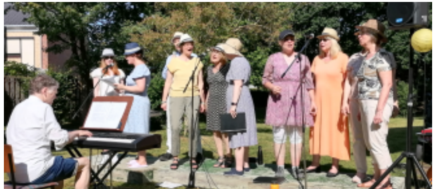
Der Gospelchor MaJoy sorgt für gute Laune!