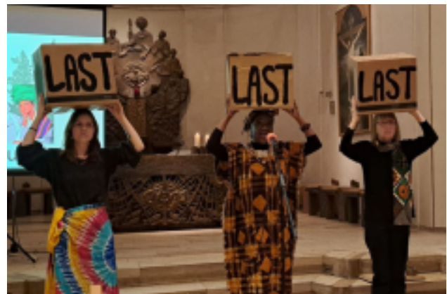
Drei Frauen beschreiben stellvertretend ihre Last

Der nächste Weltgebetstag findet 2027 unter dem Titel „für Gerechtigkeit und Frieden – 100 Jahre Weltgebetstag“ in der Segensgemeinde Harburg statt.