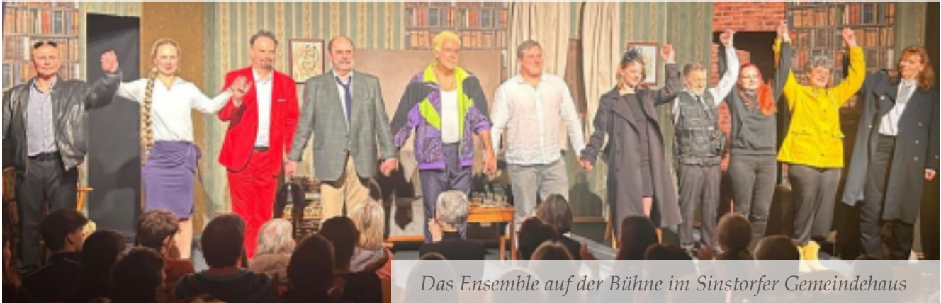
Das Ensemble auf der Bühne im Sinstorfer Gemeindehaus

Liebe Freundinnen und Freunde des Kattenberger Hoftheaters,