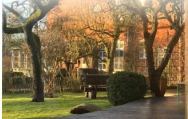
Terrasse und Garten des Seminarhauses laden zur Entspannung ein!

Infos dazu bei Katja Middelhoff 760 08 50 oder Anke Suckau 760 01 26.