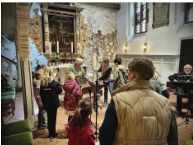
Nach dem Segenslied gab es die Möglichkeit, sein persönliches Osterlicht mit nach Hause zu nehmen.