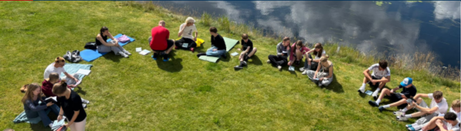
Norwegenfreizeit – Zeit gemeinsam verbringen