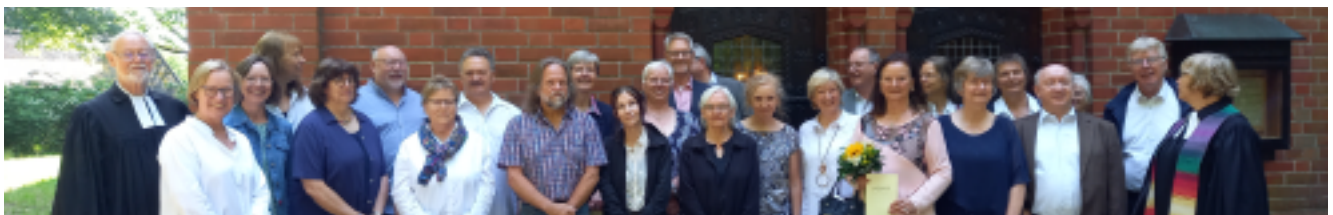
rege Beteiligung: Goldene Konfirmation 2023

Herzliche Einladung an die Konfirmationsjahrgänge 1974, 1975 und 1976: